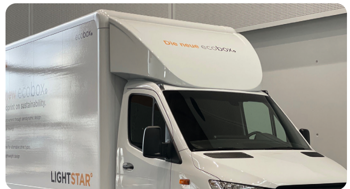
Really fair: the ecobox - our price-neutral facelift for sustainability.

* Illustrations include optional equipment